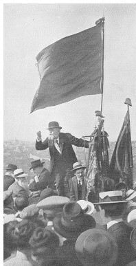
Jean Jaurès en train de convaincre

T'es tu souvent remis en cause ? Si oui, tu peux faire de la politique.